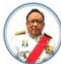
ศ. (พิเศษ) ชงทอง จันทรางศุ