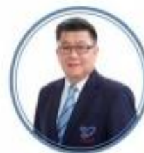
ศ.ดร.ชาญณรงค์ พรุ่งโรจน์