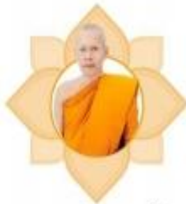
พระมหาสมัคร มหาวีโร คณบดีคณะมนุษยศาสตร์