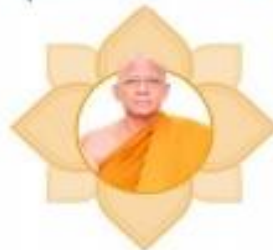
พระเทพสังวรญาณ