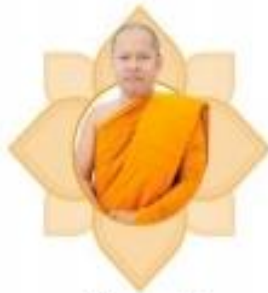
พระศรีวินยากรณ์, ดร. คณบดีบัณฑิตวิทยาลัย