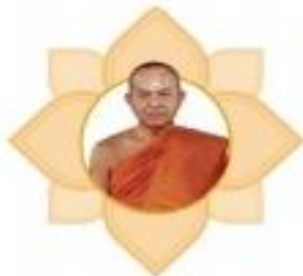
พระพรหมวิสุทธาจารย์