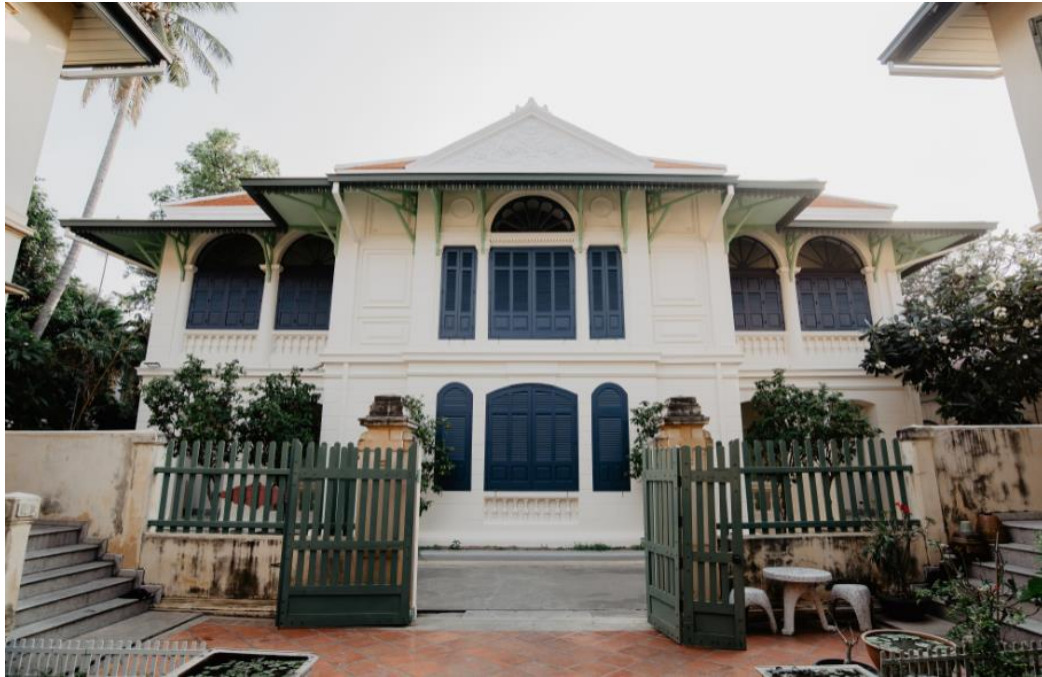
ตำหนักกลาง วัดบวรนิเวศวิหาร ที่ตั้งสำนักงานของมหาวิทยาลัยมหามกุฏราชวิทยาลัยในระยะแรกก่อตั้ง