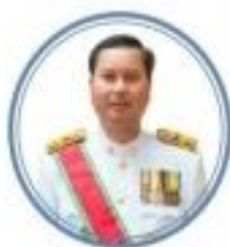
ดร.สุภัทร จำปาทอง ปลัดกระทรวงศึกษาธิการ