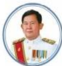
นายอำนาจ วิชยานุวัติ เลขาธิการ สภากาการศึกษา