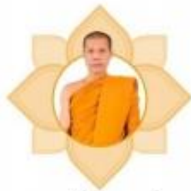
พระปริยัตินวมเมธี รองอธิการบดี วิทยาเขตสิรินธรราชวิทยาลัย