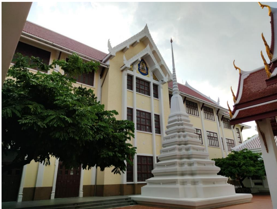
ตึกสภาการศึกษา มหามกุฏราชวิทยาลัย วัดบวรนิเวศวิหาร

เป็นสิ่งจำเป็นและมีความสำคัญอย่างยิ่งต่อการเผยแผ่พระพุทธศาสนา และผู้เผยแผ่พระพุทธศาสนา จำเป็นต้องมีความรู้ความสามารถในการสอนธรรมะที่ทันสมัย และทันต่อความเปลี่ยนแปลงของสังคม โลกและวิทยาการด้านต่าง ๆ จึงอนุมัติให้เปิดดำเนินการจัดตั้งโครงการบัณฑิตศึกษาขึ้น เพื่อเปิดสอน ในระดับปริญญาโท และปริญญาเอก เรียกว่า “บัณฑิตวิทยาลัย มหาวิทยาลัยมหามกุฏราชวิทยาลัย” เมื่อวันที่ 25 ธันวาคม พ.ศ. 2530 โดยได้เปิดสอนในระดับปริญญาโท ครั้งแรกเมื่อวันที่ 3 มิถุนายน พ.ศ. 2531