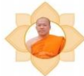
พระเทพโมลี