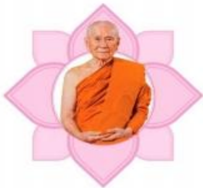
สมเด็จพระอริยวงศาคตญาณ สมเด็จพระสังฆราช สกลมหาสังฆปริณายก นายกสภามหาวิทยาลัยมหามกุฏราชวิทยาลัย

คณะกรรมการสภามหาวิทยาลัยมหามกุฏราชวิทยาลัย ผู้ทรงคุณวุฒิ (บรรพชิต)