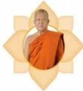
พระครูวิบูลศีลขันธ์ หัวหน้าสำนักงานอธิการบดี