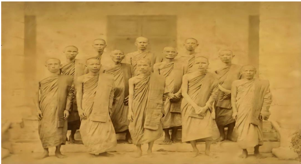
กรรมการสภามหาวิทยาลัย เมื่อวันที่ 6 ตุลาคม ร.ศ 116 (พ.ศ 2440) แฉกหน้า

“มหาวิทยาลัยมหามกุฏราชวิทยาลัย” เดิมเป็นวิทยาลัยเรียกว่า “มหามกุฏราชวิทยาลัย” ได้รับการสถาปนา (จัดตั้ง) ขึ้นโดยพระบรมราชานุญาตในพระบาทสมเด็จพระจุลจอมเกล้าเจ้าอยู่หัว รัชกาลที่ 5 เมื่อวันที่ 1 ตุลาคม ร.ศ.112 (พ.ศ. 2436) ซึ่งเป็นวันคล้ายวันสวรรคตพระบาทสมเด็จพระปรเมนทรรามาธิบดี ศรีสินทรมหามงกุฏ พระจอมเกล้าเจ้าอยู่หัว พระสยามเทวมหามกุฏวิทยมหาราช รัชกาลที่ 4 และได้ พระราชทานนามว่า “มหามกุฏราชวิทยาลัย” เพื่อถวายเป็นพระบรมราชานุสรณ์เฉลิมพระเกียรติแต่สมเด็จพระบรมชนกนาถ ผู้ทรงเป็นปราชญ์ทางพระพุทธศาสนาที่สำคัญพระองค์หนึ่งของไทย ดังความในวัตถุประสงค์ ของการสถาปนา “มหามกุฏราชวิทยาลัย” ตอนหนึ่งว่า “เพื่อเป็นที่เล่าเรียนศึกษาพระปริยัติธรรมของภิกษุ สามเณร” ในแจ้งความของกระทรวงธรรมการ ลงวันที่ 23 กุมภาพันธ์ พ.ศ. 2436 (ร.ศ.112) ประกาศใน ราชกิจจานุเบกษา เล่ม 10 หน้า 526