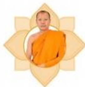
พระอุดมธีรคุณ ผู้อำนวยการมหาวิทยาลัยเทคโนโลยีราชมงคล พระสังฆราชูปถัมภ์